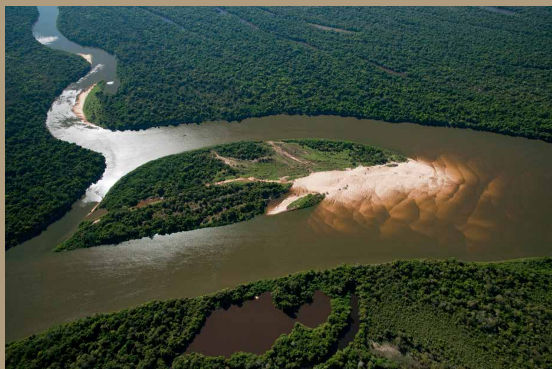
Vista aérea do Rio Araguaia, Tocantins, Brasil.

Para chegar ao Peru é possível em uma pequena embarcação conhecida na região como “voadeira”, que são canoas com um pequeno motor, bastam cerca de 5 a 10 minutos e chega-se a pequena vila de Santa Rosa, uma pequena vila de pescadores, que tem em sua rua principal, restaurantes, e casas bem simples. Os moradores simpáticos recebem os poucos turistas com muito carinho.