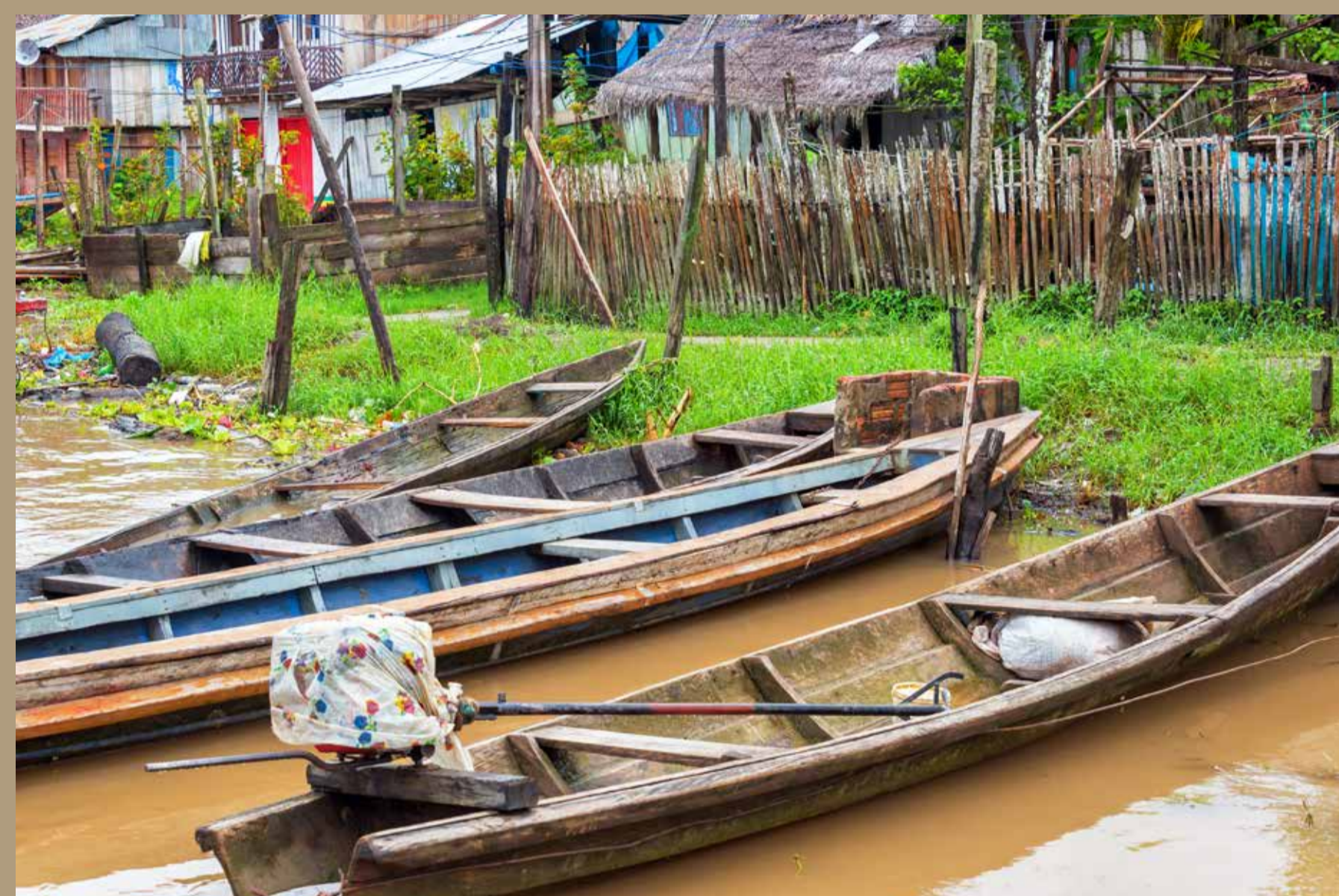
Canoas no rio da Amazônia. Tamshiyacu.

O rio Solimões guarda muitos segredos, muita vida, uma variedade de peixes. O pirarucu, que pode passar fácil de quatro metros de comprimento, é considerado o rei do rio, com sua carne tenra e saborosa, sabor parecido ao bacalhau, é uma iguaria deliciosa! O tambaqui, a sulamba, surubim.