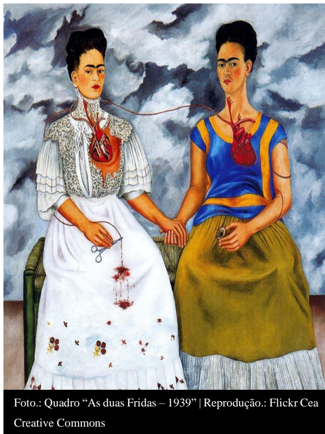
Foto.: Quadro "As duas Fridas – 1939"

"Assim como os autorretratos confirmavam sua existência, as roupas faziam com que a mulher frágil, quase sempre presa à cama, se sentisse mais magnética, mais visível e mais enfaticamente presente como objeto físico no espaço. Paradoxalmente, eram uma máscara e uma moldura. Uma vez que definiam a identidade de quem as usava em termos de aparência, as roupas distraiam Frida — e o observador — da dor interior", escreveu Herrera em Frida - a biografia.