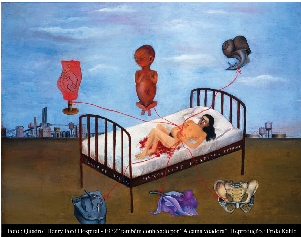
Foto.: Quadro “Henry Ford Hospital - 1932” também conhecido por “A cama voadora” | Reprodução.: Frida Kahlo

Em nome de todas as sequelas deixadas pelo acidente, a artista viu seu desejo pela maternidade ser ameaçado, porém, continuava acreditando que através de uma cesariana conseguiria dar à luz. Após sofrer três abortos que lhe traumatizaram profundamente causando pavor em continuar vivendo com a impossibilidade de ser mãe e por conta da instabilidade de sua saúde, um agravante fez com que os médicos decidissem pela amputação de sua perna direita, essa decisão impactou inteiramente em sua vaidade, Frida perdeu o anseio de viver passou a se entregar inteiramente ao seu trabalho.